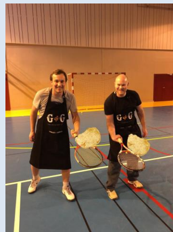
Georges & Georges au TCSD

Notre club house s'est transformé en crêperie le mercredi 1er février, pour le plus grand plaisir des élèves et de leur famille.